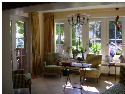
Erde und Metall im Wohnhaus

Ich hoffe, dass ich Sie inspirieren konnte, Ihre inneren und äußeren Räume auf den Herbst vorzubereiten